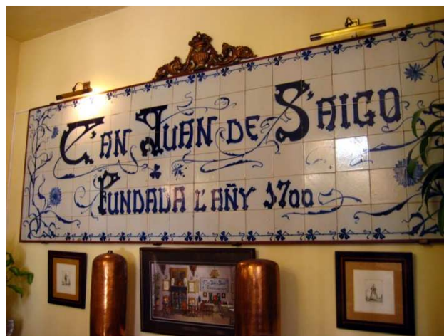
Can Joan de s'aigo , un lloc que no us podeu perdre per assaborir un bona coca.