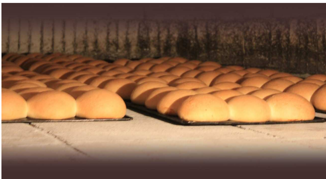
Coques de patata al forn de Can Molinas.

Tradicionalment , però, la coca de patates es presentava en racions que es treien de coques més grosses. Va esser Don Miquel Cañellas , del forn de Can Molinas de Valldemossa qui va millorar l'elaboració i popularitzà un format "individual", devers l'any 1920 .