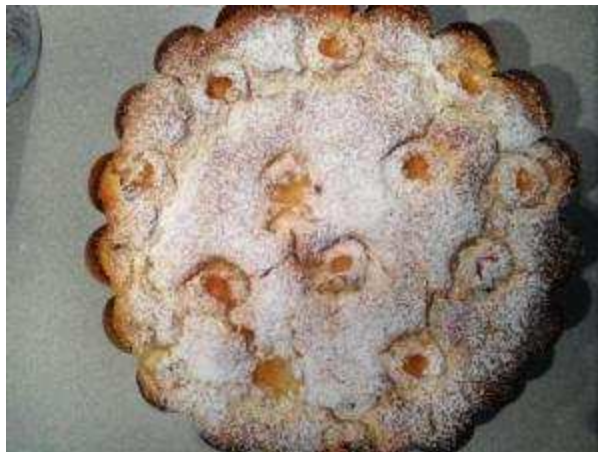
Coca de patata amb albercocs