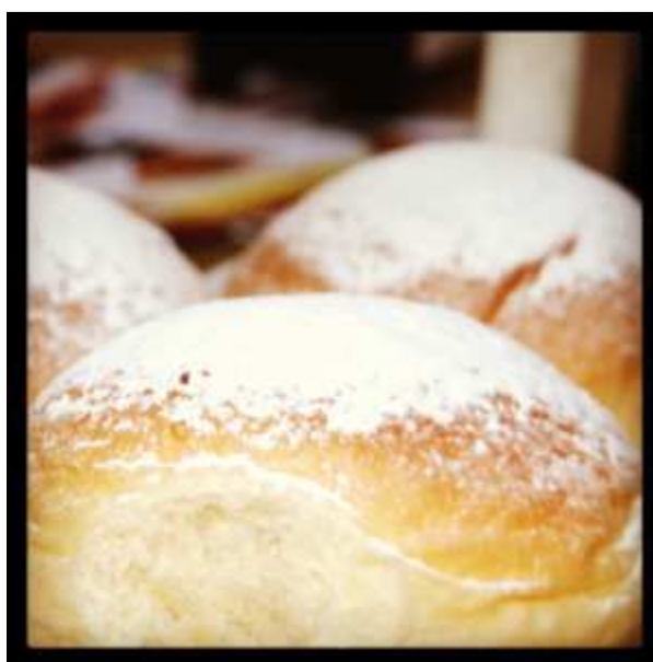
Coques de patata