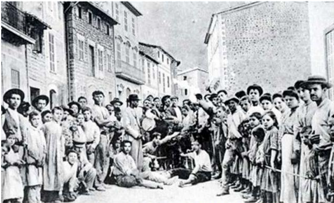
XEREMERS DE PRIMERS DE SEGLE XX A SÓLLER