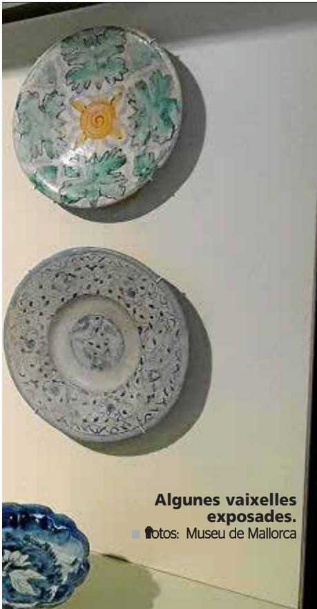
Algunes vaixelles exposades.