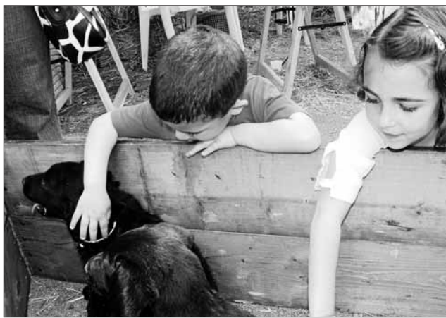
Els petits s'interessaren sobretot per les mascotes.