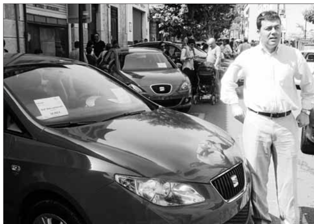
Fons Auto també mostrà les seves novetats més importants.