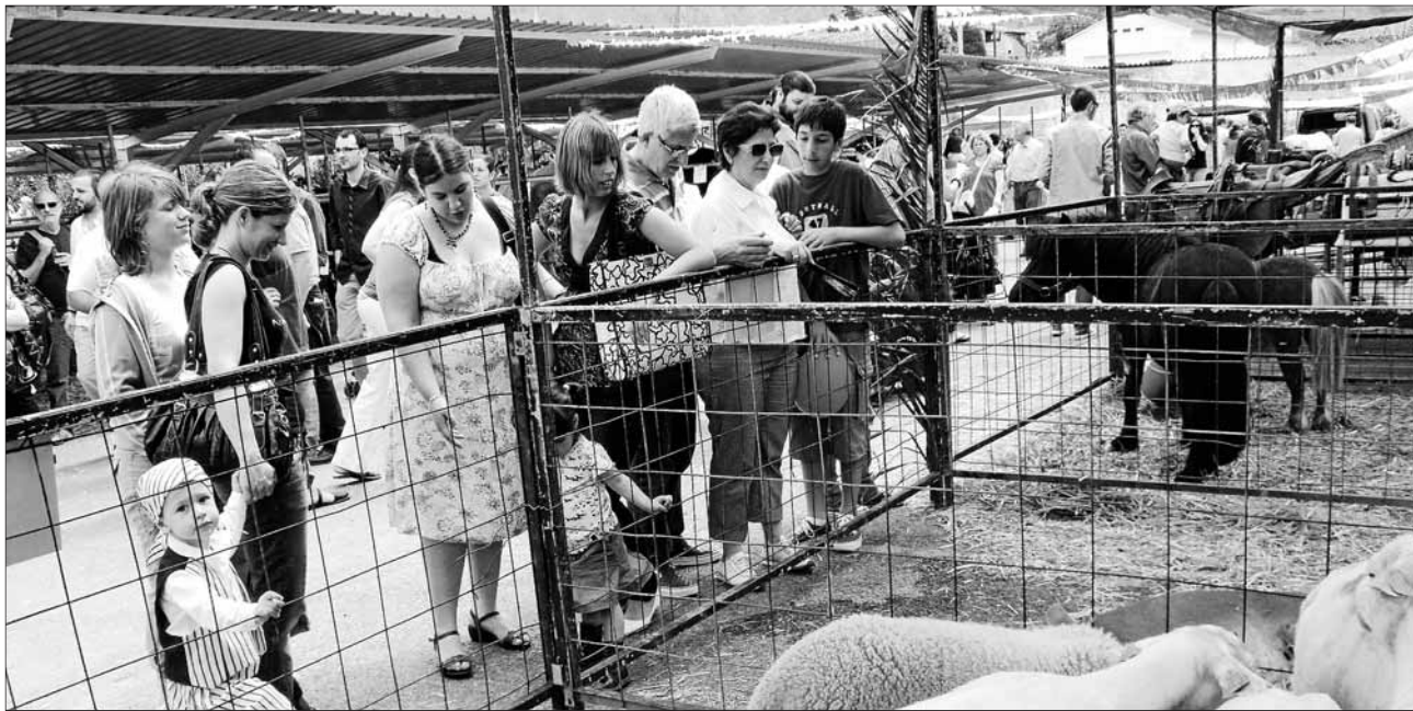
Des de fa uns anys, la Mostra Ramadera és un dels esdeveniments de la Fira que reuneix més públic. La ubicació és ideal.