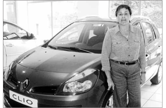
Germans Palou, Renault, exposà els darrers models en el mercat.