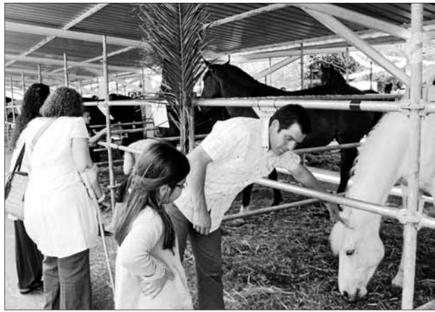
Els cavalls són sempre els animals més admirats de la mostra.