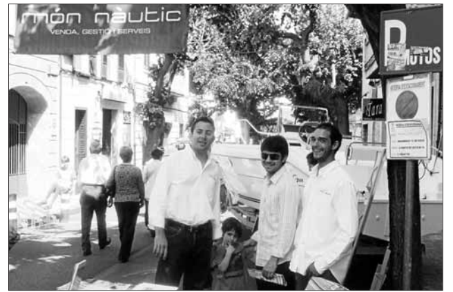
El Món Nàutic també va tenir enguany la seva exposició.