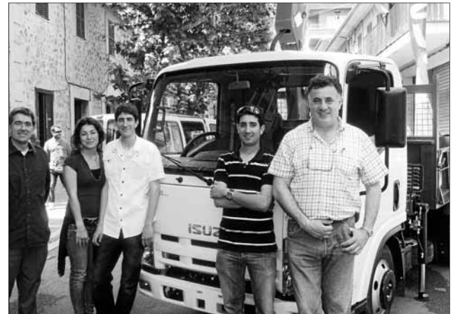
Un altres dels expositors comercials de vehicles.