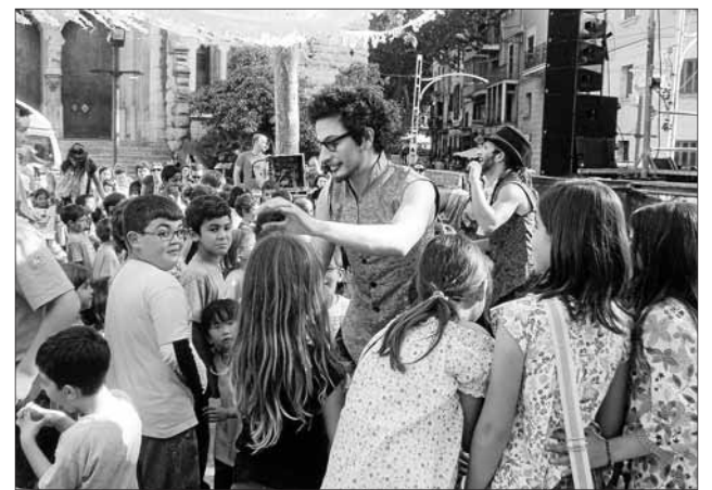
Dissabte també hi hagué entreteniment pels més petits.