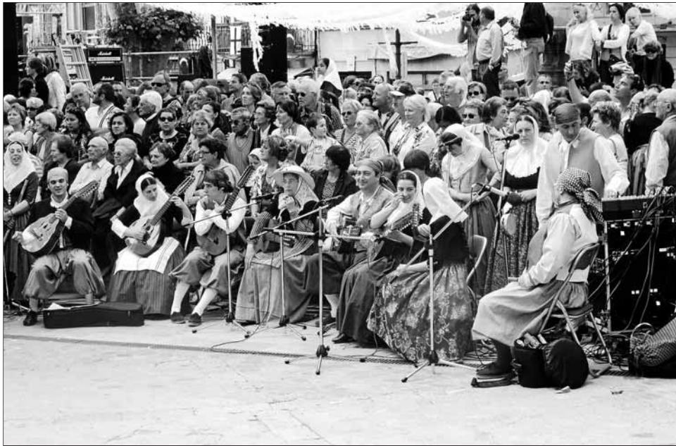
El grup Aires Sollerics, amenitzant amb música popular l'acte de l'ofrena floral.