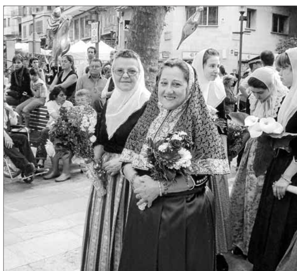
Dues pageses ben mudades participant en la popular processó. L'esdeveniment s'ha convertit en una bona ocasió per treure dels armaris rebossillos, mantes, capes i gual-laretos.