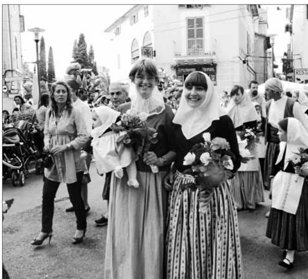
Regidores de l'Ajuntament vestides a l'antiga durant l'ofrena de flors. Només una minoria de regidors i regidores utilitzaren enguany el vestit pagès.