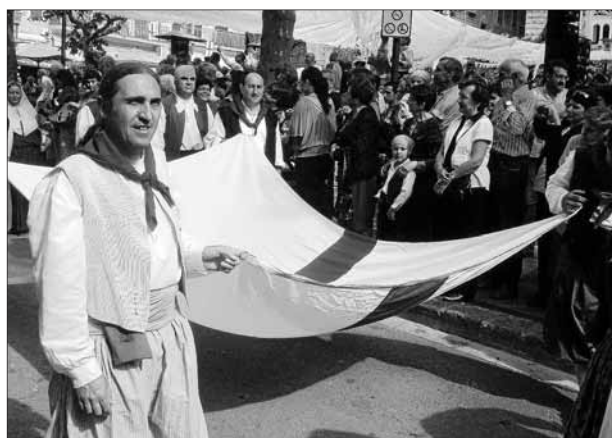
L'estendard de St. Jordi, portat per pagesos abans de l'hissada.