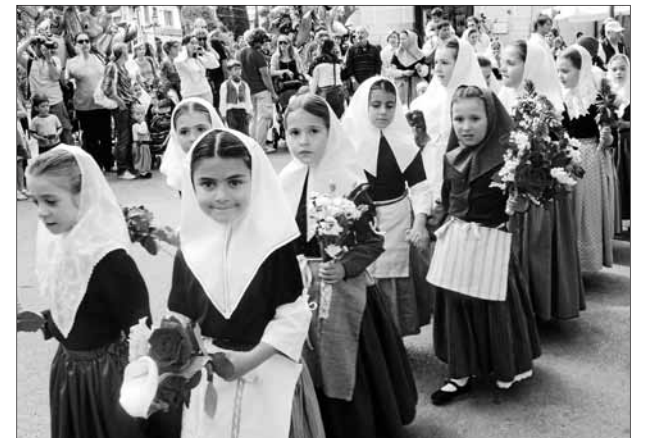
Un grup de pagesetes amb flors per dur a la Mare de Déu.