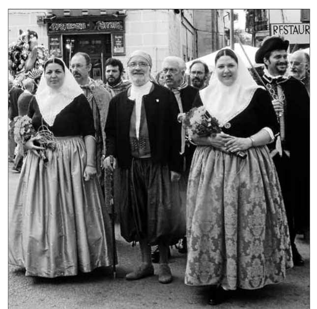
El batle, vestit a l'antiga, i les Valentès Dones de Can Tamany.