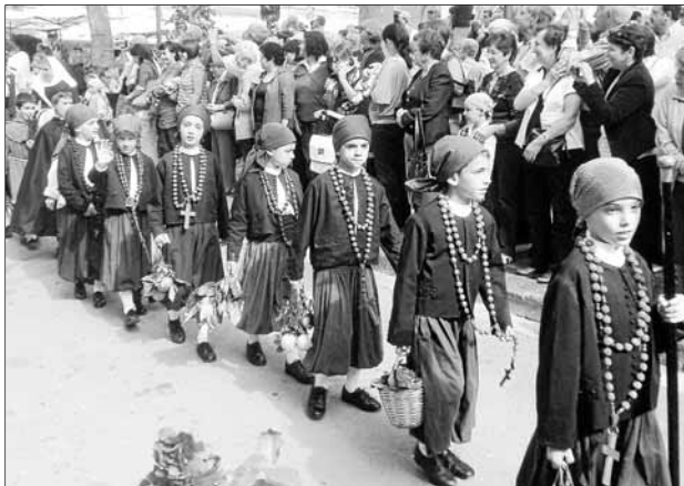
Personatges històrics infantils durant la processó de dissabte.