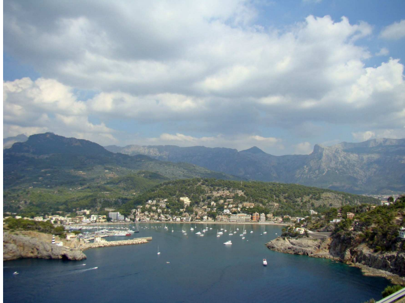
Port de Sóller actualitat