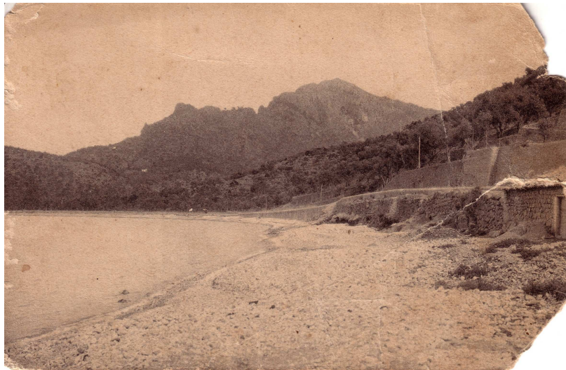
Port de Sóller a 1885

Història de la gastronomia a Sóller a través dels anuncis, notes i col·laboracions del setmanari Sóller ( 1885-1996)