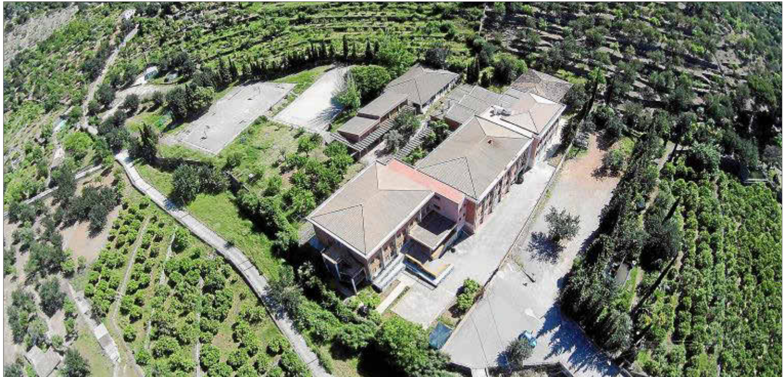
Vista panoràmica actual del centre educatiu de secundària IES Guillem Colom Casasnovas.

L'Associació de pares del CEIP Es Puig era partidària que el centre nou es construís devora l'escola que ja hi havia, però encara no hi havia res decidit. Hi havia algunes qüestions prèvies a resoldre: el poble havia de cedir uns terrenys de 10.000 m 2 al Ministeri d'Educació i Ciència, el nou centre havia d'estar a prop del centre urbà i també s'havien de tenir en