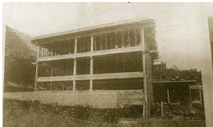
La premsa local es féu ressò de la construcció de l'edifici.

compte les connexions d'aigua i llum de les noves instal·lacions