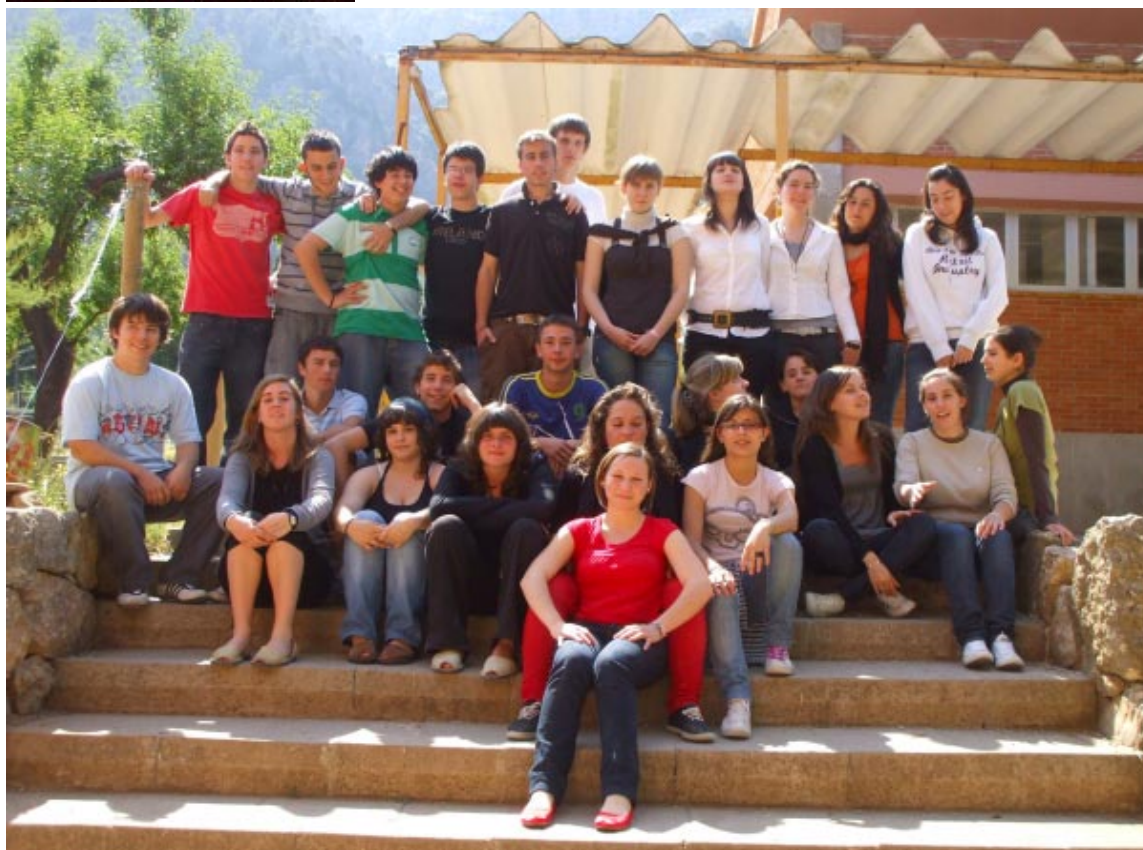
Fotografia : Segon de batxillerat